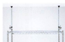
セーフティポール P.77