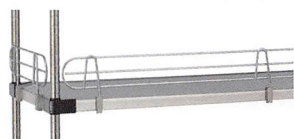
バックレッグ/サイドレッグ P.78